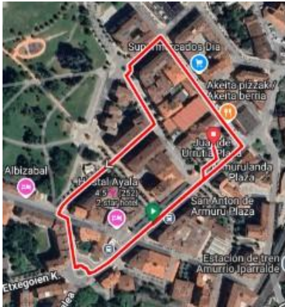
Vuelta pequeña (1000m)

En todas las carreras, la salida estará situada en la C/ Elexondo nº2 y la meta en la plaza Juan de Urrutia. Estos son los diferentes circuitos.