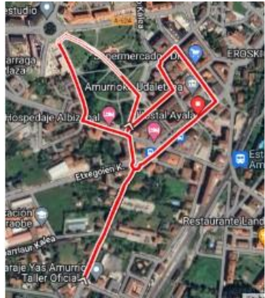
Vuelta grande (2000m)